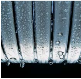
Inox-Radial-Wärmetauscher – langlebig und effizient