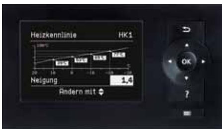
Vitotronic Regelung – einfache Bedienung durch menügeführte Benutzerführung und grafische Darstellungen, wie zum Beispiel der Heizkennlinienanzeige