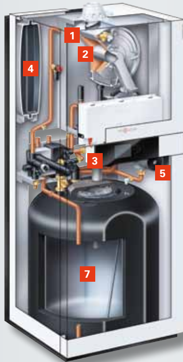
Vitodens 222-F (Typ B2TA) mit emailliertem Ladespeicher