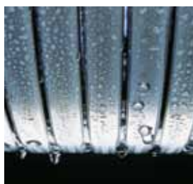
Inox-Radial-Wärmetauscher – langlebig und effizient