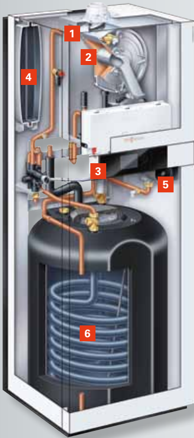
Vitodens 222-F mit emailliertem Rohrwendel-Warmwasserspeicher (Typ B2SA) für Gebiete mit hartem Wasser