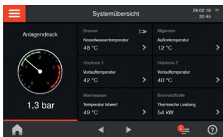
Großes Farb-Touch-Display als zentrale Informationsquelle